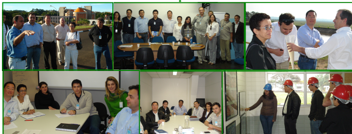
Técnicos da Fundace conhecem a empresa para buscar subsídios para a elaboração do modelo de Balanço Ambiental Contábil da Sabesp. RG, MN, RV, CJA, MTP e MTTA

Para conceber um modelo conceitual de balanço ambiental contábil para a Sabesp, a Superintendência de Gestão Ambiental - TA - contratou os serviços de consultoria da Fundação para Pesquisa e Desenvolvimento da Administração Contábil de e Economia - Fundace - formada por pesquisadores da Faculdade de Economia e Administração da Universidade de São Paulo - USP - de Ribeirão Preto. Para o desenvolvimento desse modelo, a TA conta também com o indispensável apoio da Superintendência de Contabilidade - FC.