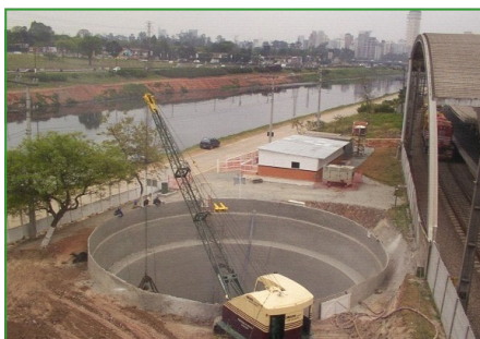
Obras da EEE Pomar

Destaca-se a importância desse procedimento na mudança de cultura da empresa nas questões ambientais: com a introdução desses